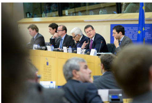
Anhörung zur Energieunion mit Kommissar Maroš Šefčovič im Umweltausschuss 2015

Es gibt einige Bereiche des Europäischen Binnenmarktes, deren Integration noch viel stärker vorangetrieben werden muss. Dazu zählt auch der lebenswichtige Sektor Energie. Tatsächlich ist die Idee, die Energieproduktionen unter eine gemeinsame Aufsicht zu stellen, ein zentrales Gründungselement der Europäischen Gemeinschaft nach dem Zweiten Weltkrieg. Die Montanunion war die Keimzelle der heutigen EU, und die Bedeutung des Energiesektors ist nach 65 Jahren noch dramatischer.